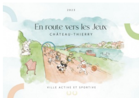
JEUX OLYMPIQUES ET PARALYMPIQUES PARIS 2024 Appel à projets à destination des associations