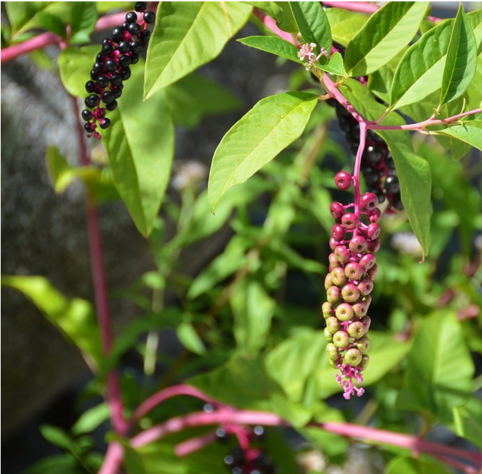
[Raisin d'Amérique ( Phytolacca americana ) envahissant et très toxique]

Si vous voyez cette plante, dans votre jardin par exemple, le mieux est de la retirer pour ne pas attirer les oiseaux qui sont un des principaux facteurs de disséminations des graines dans les campagnes.