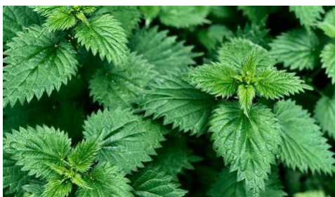
[ortie (syn. urtica )]

Quand on parle de perte de biodiversité, le sort des grands animaux capte souvent l'attention mais les insectes sont d'une importance vitale pour les écosystèmes planétaires. La disparition des insectes aurait un effet domino dévastateur pour toute la chaîne trophique, pour les écosystèmes comme pour l'humanité. Nous ne sommes qu'à l'heure du constat, rien n'est donc perdu et nous pouvons l'éviter, changeons nos méthodes d'entretien des espaces verts et mettons tout en œuvre au quotidien pour préserver et favoriser les insectes qui sont à la base de la vie sur Terre »