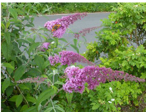
[Arbre aux papillons (buddleia)]

Puisqu'il demeure vendu en jardinerie sous cette appellation trompeuse, il ne faudrait donc pas nous résoudre à planter un "arbre aux papillons" dans l'intention de soutenir les papillons sans préserver en parallèle l'intégralité des fleurs et des plantes sauvages.