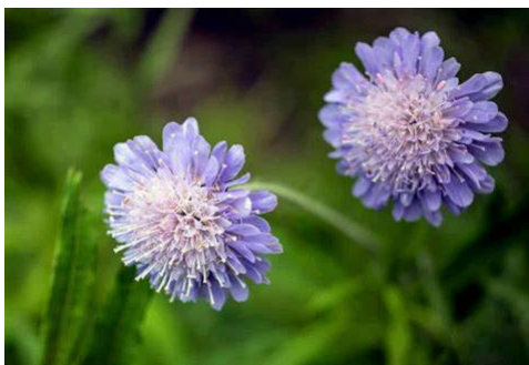
[scabieuse des prés ou scabieuse des champs ( Knautia arvensis syn. Scabiosa arvensis )]

Il nous suffit juste de remettre en question la définition du "PROPRE" qui nous a été transmise pour préférer laisser pousser, vivre et fleurir.