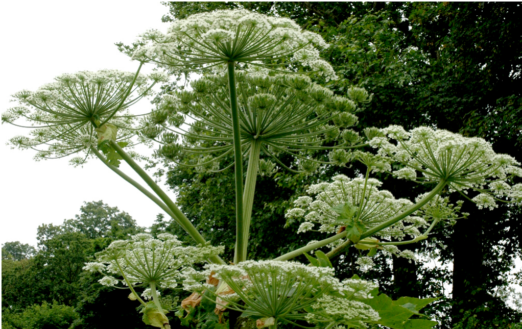
[La berce du Caucase]