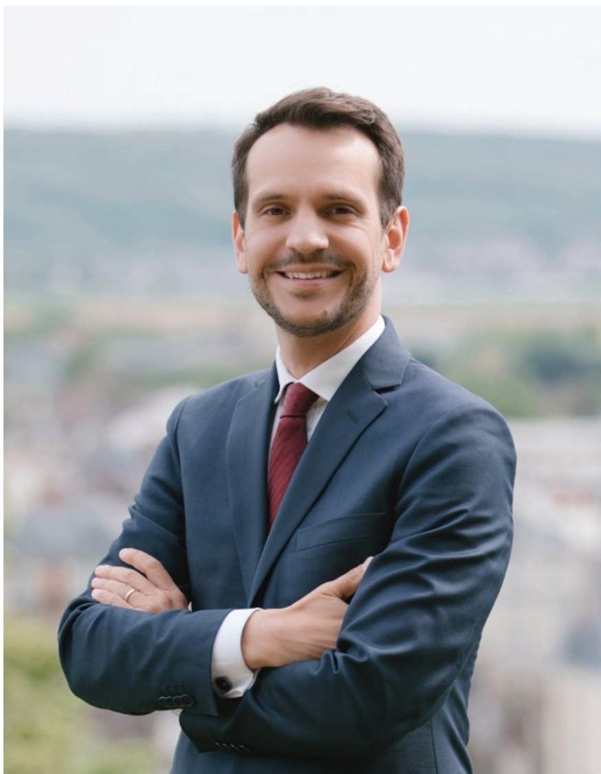
Sébastien Eugène, Maire de Château-Thierry Conseiller départemental

Château-Thierry, cité poétique : le nom de notre ville reflète sa vocation à concilier la réponse aux besoins ordinaires, l'utilitaire, et l'émotion, l'ouverture à l'imaginaire et au dépassement esthétique ou symbolique. Entre terre et eau, entre vallée et coteaux, entre château et faubourgs, entre région parisienne, Hauts-de-France et Champagne, de la période romaine à nos jours, Château-Thierry ambitionne de se nourrir de ses contrastes en les (ré)conciliant.